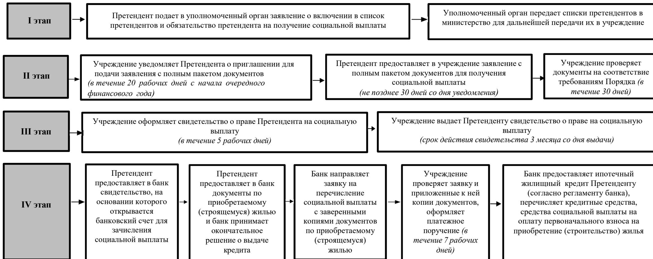
Схема получения педагогическими, медицинскими и социальными работникам социальных выплат на оплату первоначального взноса при приобретении (строительстве) жилого помещения с использованием ипотечного жилищного кредит

Уполномоченный орган - органы исполнительной власти Краснодарского края: министерство здравоохранения Краснодарского края, министерство образования, науки и молодежной политики Краснодарского края, министерство труда и социального развития Краснодарского края